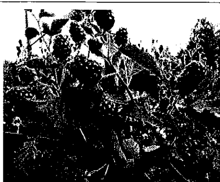
ブラックベリーの実